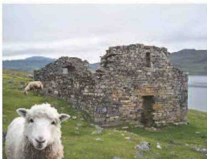
Borderline(s) investigation #1 from TNG/CDN Lyon on Vimeo

Dans le processus créatif figure l'approche de terrain comme cette fois-ci la visite d'une exploitation porcine en Bretagne, parce qu'il est question de l'élevage intensif et de l'extinction de la biodiversité pour aborder ces frontières énoncées dans le titre, ce monde « fini et de plus