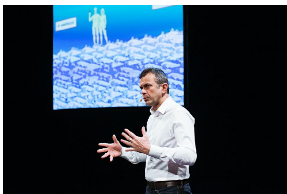
«De la morue – cartographie 6», du fougueux conférencier, en mars au Monfort, à Paris XVe.

Passionné par la transmission ludique des savoirs, l'artiste-conférencier présente « Borderline(s) Investigation #1 », étude incongrue de l'effondrement du monde. Rencontre.