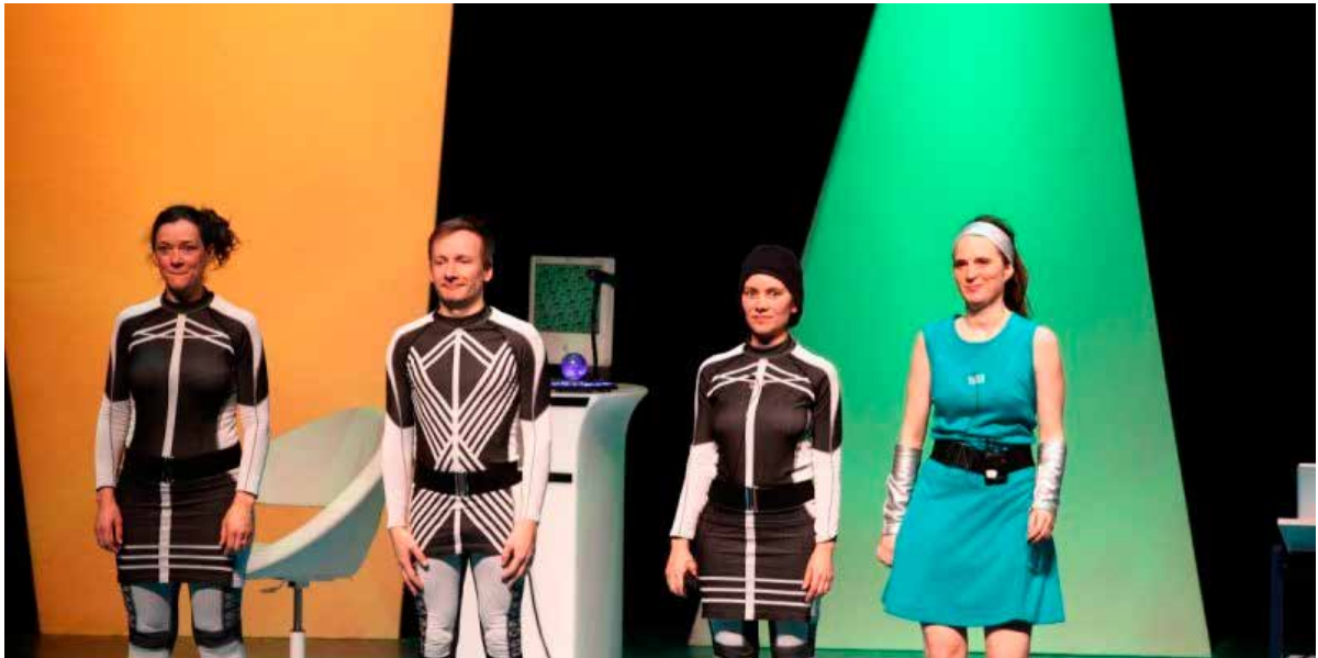
Les comédiens de la compagnie Vertical Détour, à Saintes.